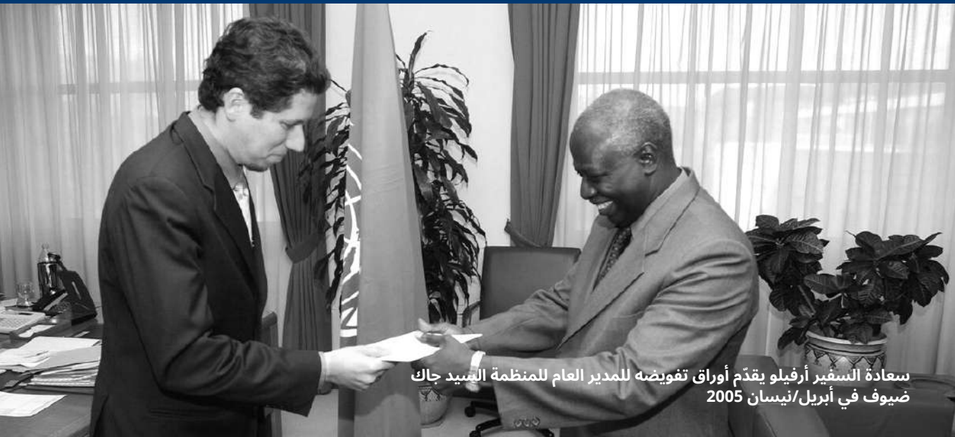
سعادة السفير أرفيلو يقدّم أوراق تفويضه للمدير العام للمنظمة السيد جاك ضيوف في أبريل/نيسان 2005

وترد معلومات إضافية عن خبرة سعادة السفير أرفيلو في القطاعين العام والخاص والمجتمع المدني والأكاديمية وغيرها من المجالات، بما في ذلك مؤلفاته ومشاركته في أفرقة الخبراء الدولية، على الموقع الإلكتروني www.marioarvelo.com في اللغات الستة الرسمية للأمم المتحدة.