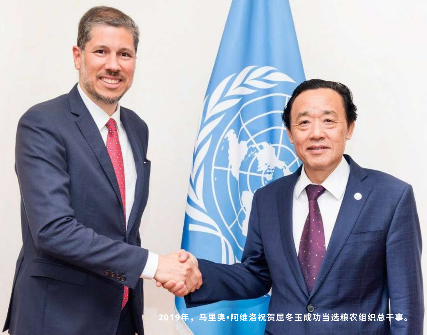
2019年，马里奥·阿维洛祝贺屈冬玉成功当选粮农组织总干事。